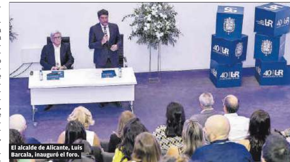
El alcalde de Alicante, Luis Barcala, inauguró el foro.

El V Congreso anual del Grupo UR Internacional reunió alrededor de 200 especialistas en medicina reproductiva que trabajan en los equipos de sus 17 clínicas de fertilidad