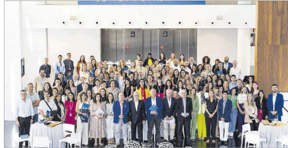
Equipo del Grupo UR Internacional en el V Congreso anual celebrado en el Auditorio de la Diputación de Alicante (ADDA).

ESPECIAL 40 ANIVERSARIO Y V CONGRESO ANUAL