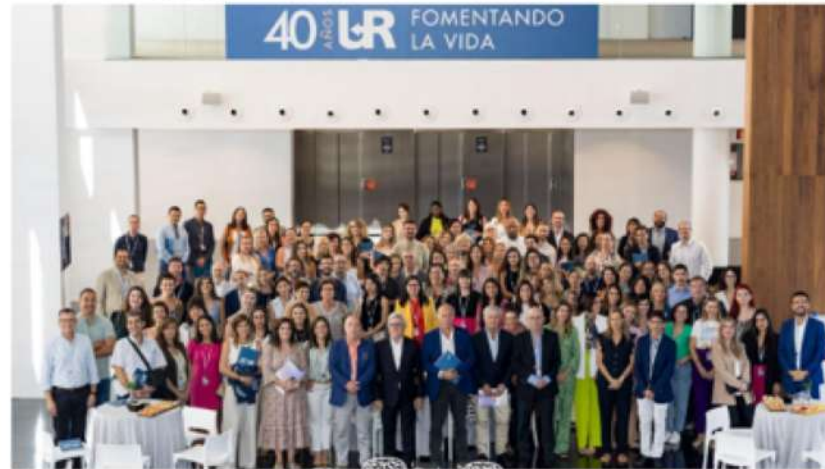
Equipo de profesionales del Grupo UR.

El alcalde de Alicante, Luis Barcala , inauguró el V Congreso del Grupo UR Internacional que reunió, el 29 y 30 de septiembre en el ADDA, alrededor de 200 especialistas en medicina reproductiva que trabajan en los equipos de las 17 unidades de reproducción que lo comprenden.