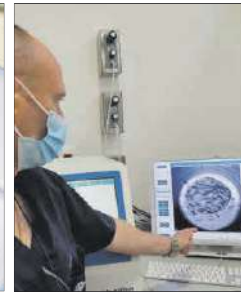
Incubadores con tecnología Time Lapse.