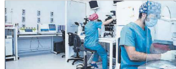
Laboratorio de embriología de la Unidad de Reproducción Vistahermosa.

«El laboratorio de embriología es el corazón de una clínica de reproducción, un espacio fundamental que ha experimentado una impresionante evolución en sólo 40 años, permitiendo hoy en día una precisión sin igual en los procedi-