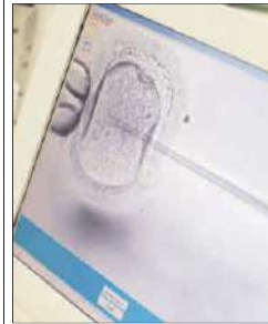
Fecundación In Vitro - ICSI.