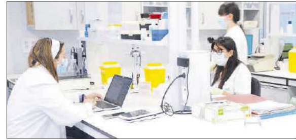
Departamento de genética reproductiva del Grupo UR.

El doctor Urbano detalla que el 10% de las infertilidades son por causas genéticas. «A día de hoy se está aplican-