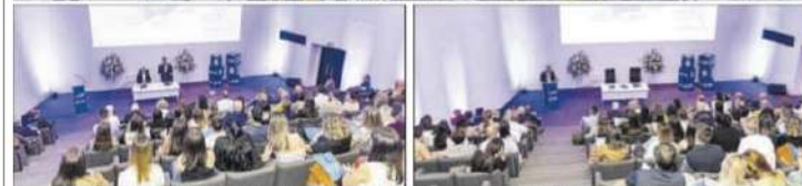
Equipo de profesionales del Grupo UR y dos momentos de las intervenciones del alcalde de Alicante y del doctor López Gálvez.

R.E. El alcalde de Alicante, Luis Barcala, inauguró el V Congreso del Grupo UR Internacional que reunió, el 29 y 30 de septiembre en el ADDA, alrededor de 200 especialistas en medicina reproductiva que trabajan en los equipos de las 17 unidades de reproducción que lo comprenden.