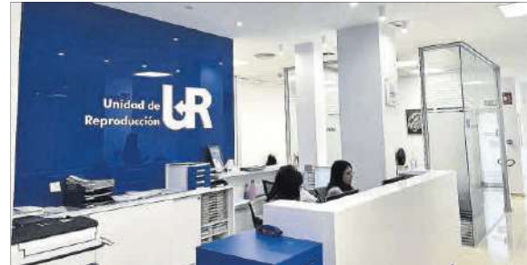
Sede central del Grupo UR ubicada en la Unidad de Reproducción Vistahermosa Alicante.