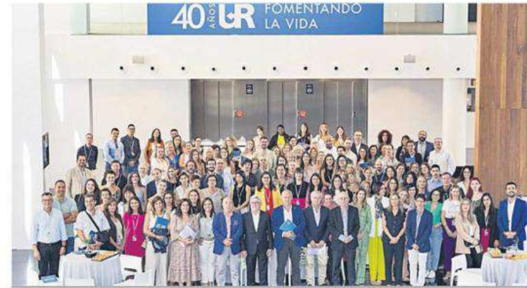
El aniversario ha reunido en Alicante durante dos días a los equipos profesionales de sus 17 clínicas de fertilidad.