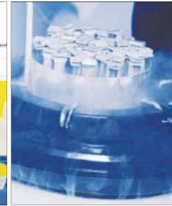
Vitrificación de óvulos.