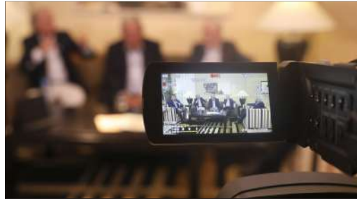
El encuentro tuvo lugar en las instalaciones de HLA Vistahermosa.

Así creó el «embrión» del Grupo UR, un proyecto que se ha convertido en referente nacional e internacional y líder en reproducción asistida. «La medicina reproductiva para