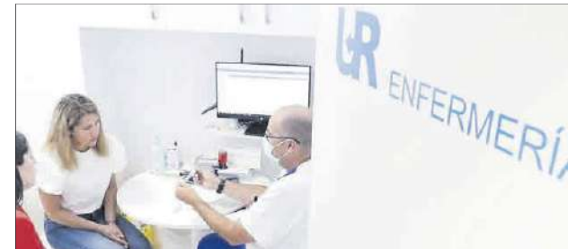
Instalaciones de la Unidad de Reproducción Vistahermosa.

Otro departamento esencial es el equipo paramédico, que brinda atención continua a los pacientes, ofreciendo la mejor acogida, acompañamiento, información, asesoramiento, coordinación, educación sanitaria o soporte emocional.