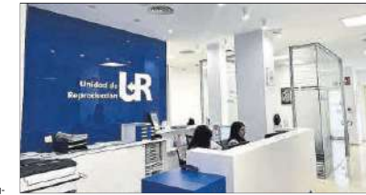
Unidad de Reproducción Vistahermosa, sede central del Grupo UR.

Los profesionales de las 17 unidades de reproducción trabajan al unísono en cada especialidad, desarrollando tratamientos personalizados para ganar eficacia y elevar los resultados